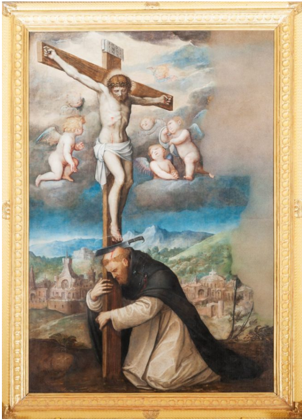
Guglielmo Caccia, Cappella di San Pietro, San Pietro Martire e il Crocifisso