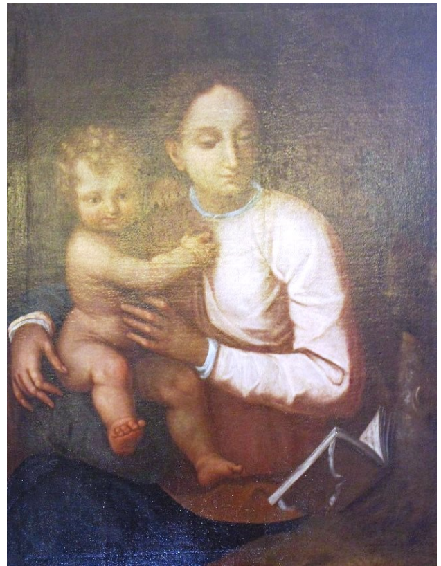
Francesco Fea?, Chiesa delle Orfanelle, Madonna col Bambino