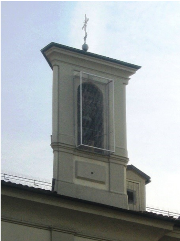
Il campanile dell'Annunziata