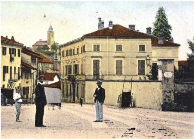
Palazzo Robbio di San Raffaele Si affaccia su via Vittorio Emanuele II, n. 8. Appartenne ad un ramo collaterale della famiglia Robbio Cartolina di inizio Novecento

Sulle pitture, le decorazioni in terracotta e sulle le vicende costruttive di Palazzo Tana si veda Il palazzo dei Tana a Chieri , Riva presso Chieri, 2002.