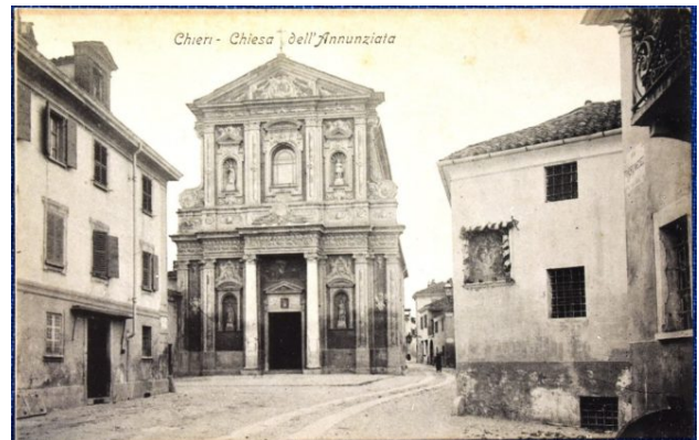
Il Santuario dell'Annunziata a inizio Novecento – Cartolina della Collezione Piovano

Santuario dell'Annunziata - Disegno acquerellato di Modesto Paroletti (1825)