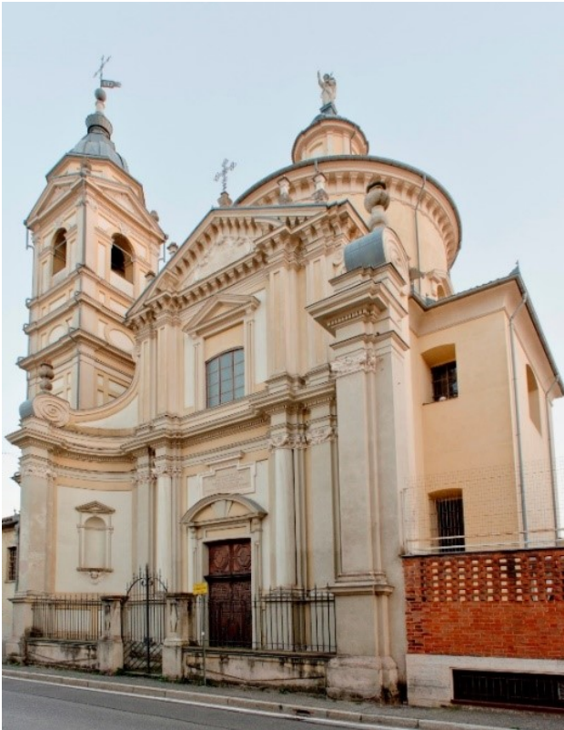
Chiesa domenicana di Santa Margherita

L'edificio ha pianta a croce greca. La facciata, a forma concava, delimita un piccolo sagrato. Terminata nel 1671, è attribuita all'architetto torinese, di origini chieresi, Francesco Lanfranchi.