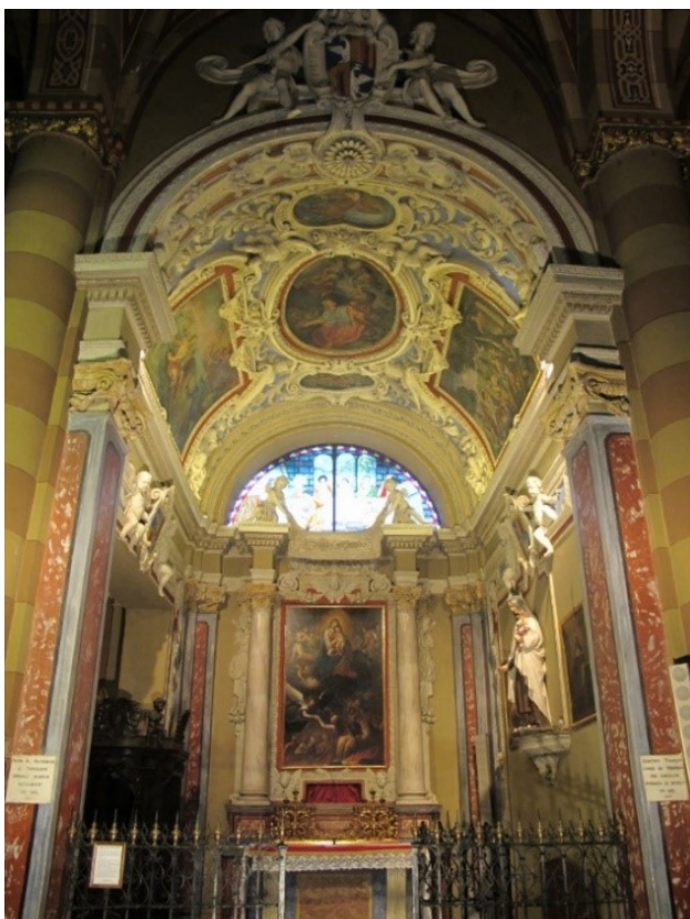
Cappella della Beata Vergine del Suffragio (Duomo)

Gioiello d'arte barocca, la cappella fu commissionata nel 1652 a maestranze luganesi da Giorgio Turinetti, banchiere di corte e Presidente delle Finanze. La pala è attribuita ai milanesi