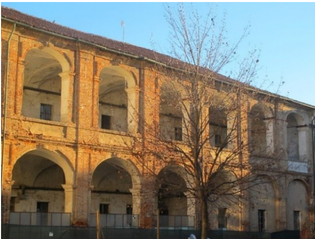
Ex Monastero di Santa Chiara, ora sede del Museo del Tessile

Per saperne di più sul monastero di Santa Chiara