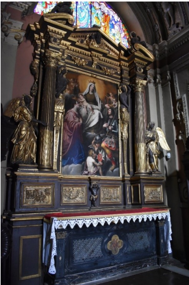
Cappella della Madonna del Carmine (Duomo)

È una delle poche cappelle del Duomo che hanno mantenuto la decorazione barocca. L'ancona lignea con scene della vita dei santi Giuliano e Basilissa, è attribuita a Michele Enaten (artista astigiano di origine fiamminga, 1643 circa). La pala d'altare (1644) è di scuola genovese. La cappella fu fatta