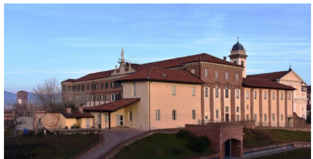
Il Convento della Pace