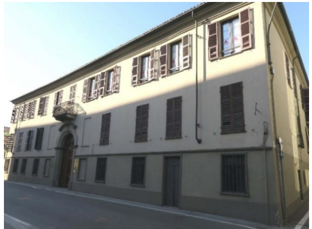
Palazzo Robbio - via Vittorio Emanuele II, n. 39