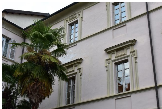
Chiostro del Noviziato dei Gesuiti - Particolare