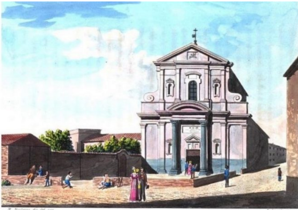
Santuario dell'Annunziata di Chieri

Santuario dell'Annunziata - Disegno acquerellato di Modesto Paroletti (1825)