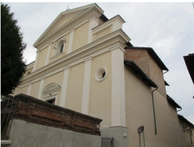
Chiesa di Santa Maria della Pace - Con il contributo di Madama Cristina di Francia, la costruzione della chiesa e del convento dei Frati Minori Riformati Francescani iniziò nel 1642 e terminò nel 1664. Il convento fu ampliato nei primi anni del