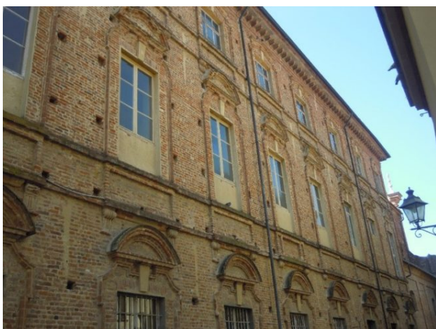
Convento dei Filippini – Prospetto su via San Filippo (inizio Settecento)

La seconda opera chierese che gli viene attribuita è la costruzione, realizzata fra il 1715 e il 1726, del primo nucleo del convento dei Filippini , ma abbiamo già esposto le ragioni di carattere cronologico che rendono molto dubbia una tale attribuzione. Bernardino Quadro, infatti, è morto nel 1695, venti anni prima che venisse costruito il convento. Se l'“ ingegner Quadro ” del quale parla il capitolato degli impresari fosse lui, vorrebbe dire che quel progetto egli lo eseguì prima di morire ma per qualche motivo fu realizzato solo venti anni dopo. Sembra più verosimile che si tratti di un'altra persona, magari di suo figlio Carlo Giulio, anche lui ingegnere.