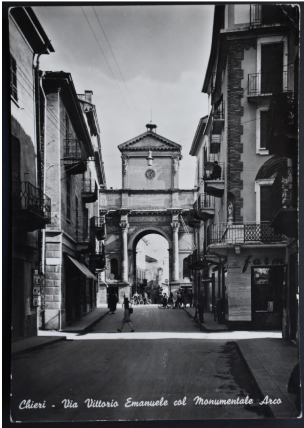
Chieri - Via Vittorio Emanuele col Monumentale Arco