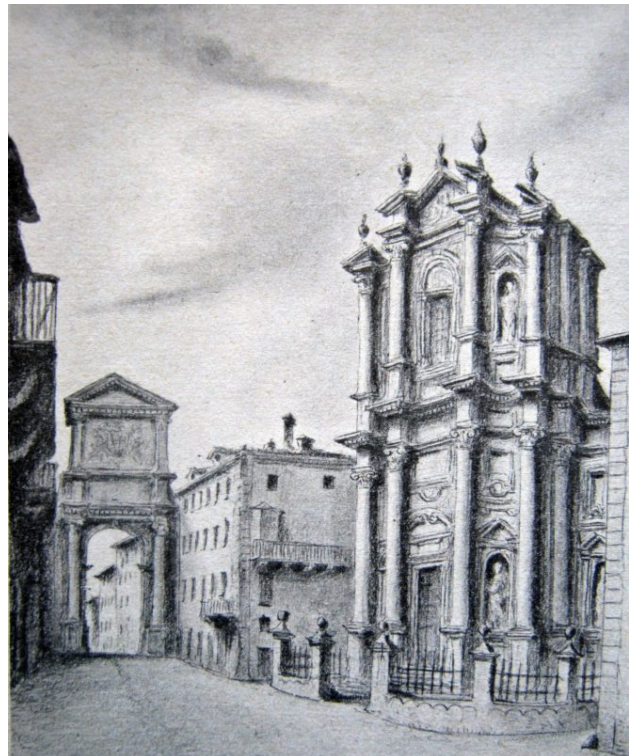
Clemente Rovere, l'Arco e la Chiesa di San Filippo nel 1850 Clemente Rovere, Veduta dell'Arco da piazza delle Erbe, 1850