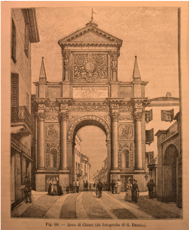
Fig. 68. — Arco di Chieri.

Arco di Chieri, in "Il Secolo", Le cento città d'Italia, 1895