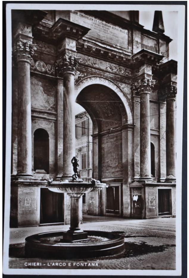
CHIERI - L'ARCO E FONTANA