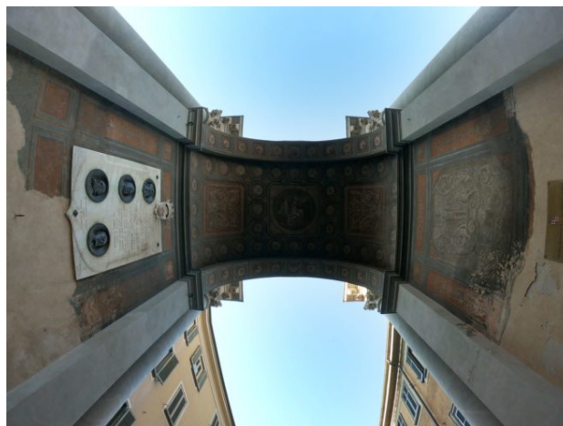
Il fornice dell'Arco

[1] O. GAYOTTI, vol. 1, p. 247. Non sappiamo quante fossero le statue perché non abbiamo disegni antichi dell'arco. Quelli che abbiamo sono di Bernardo Vittone e di M. L. Quarini e rappresentano l'arco come appariva dopo l'intervento vittoniano del 1761.