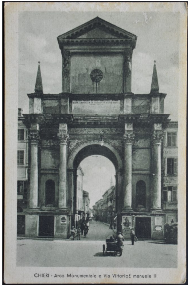
CHIERI - Arco Monumentale e Via VittorioE manuele II