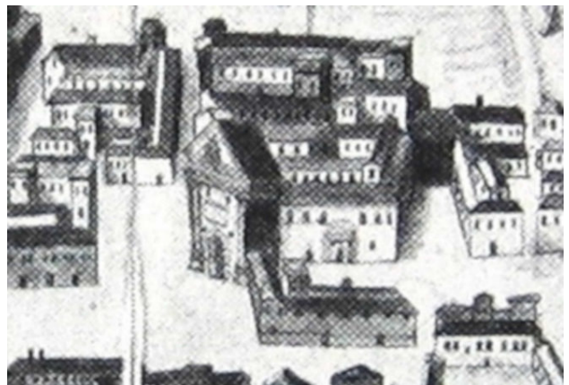
Cherium Civitas, fratelli Fea Cerruti, collez. privata, partic. della Piazza delle Erbe, 1662