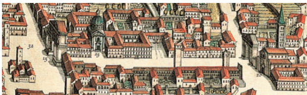
L'Arco e (a destra) la Porta di San Domenico, dal Theatrum Sabaudiae. 1682