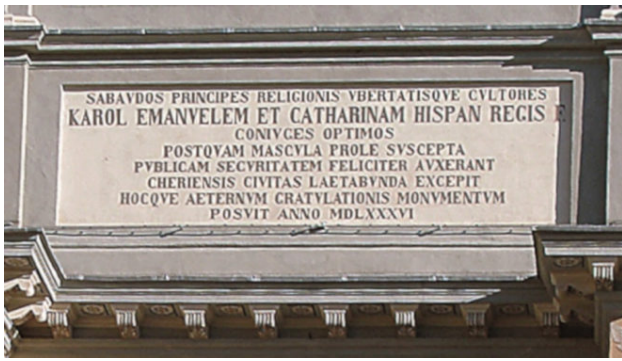
L'epigrafe (lato verso piazza Umberto) ricorda la visita a Chieri di Carlo Emanuele I e Caterina di Spagna