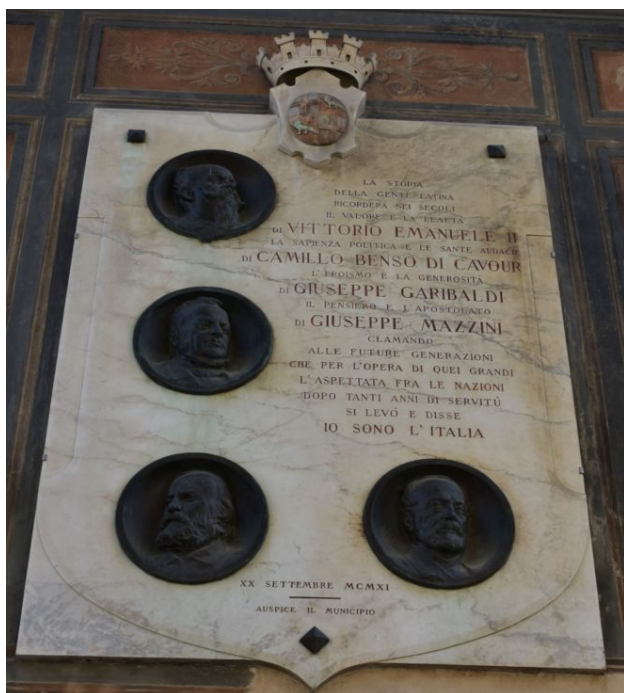
Lapide dei Padri della Patria, 1911

RICORDERÀ NEI SECOLI IL VALORE E LA LEALTÀ DI VITTORIO EMANUELE II LA SAPIENZA POLITICA E LE SANTE AUDACIE DI CAMILLO BENSO DI CAVOUR L'EROISMO E LA GENEROSITÀ DI GIUSEPPE GARIBALDI IL PENSIERO E L'APOSTOLATO DI GIUSEPPE MAZZINI CLAMANDO ALLE FUTURE GENERAZIONI CHE PER L'OPERA DI QUEI GRANDI L'ASPETTATA FRA LE NAZIONI DOPO TANTI ANNI DI SERVITÙ SI LEVÒ E DISSE: IO SONO L'ITALIA