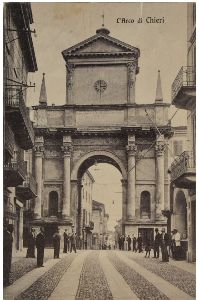
L'Arco di Chieri