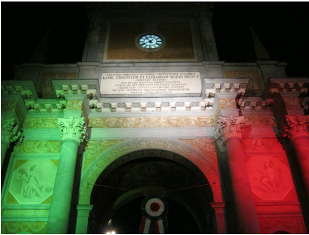
L'Arco di Chieri con l'illuminazione tricolore nel 150° dell'Unità d'Italia, 2011