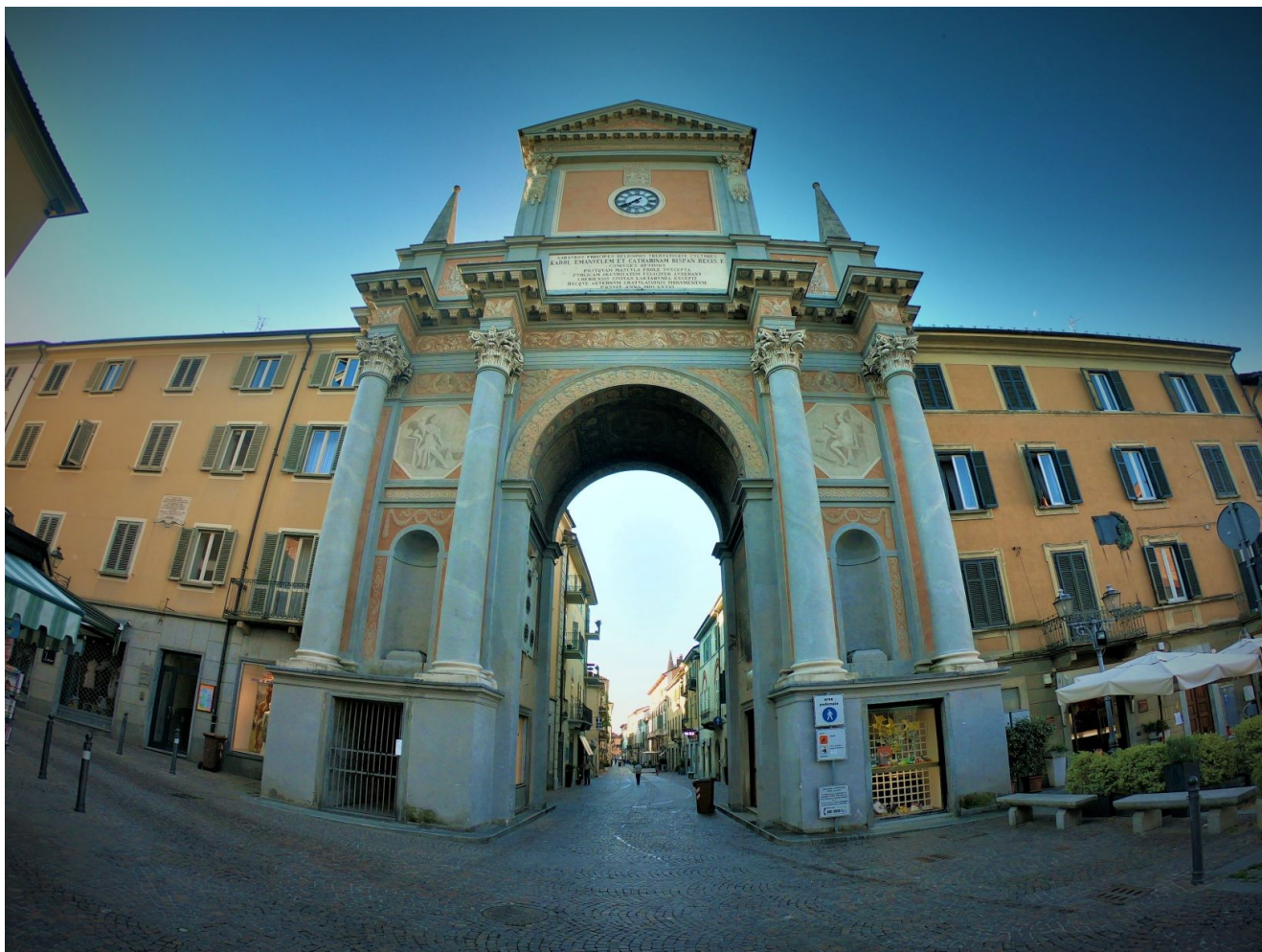
L'Arco di Piazza visto da Piazza Umberto I