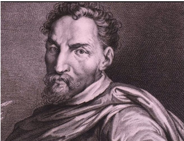
Pellegrino Tibaldi (dal web)

Ma a pagina 47, parlando dei festeggiamenti organizzati a Chieri in occasione della visita di Carlo Emanuele I, Gritella, lascia da parte ogni incertezza e prudenza e si riferisce al Tibaldi come al sicuro autore dell'arco: “ L'intervento del Tibaldi (alla visita ducale a Chieri, ndr) apre tracce d'indagine ancora inesplorate... Stando alle informazioni che possediamo, il progetto dell'arco preparato dal Tibaldi si calava in un ambizioso programma di figurazione urbana... L'arco tibaldiano con la sua presenza incombente... si apriva sulla piazza del potere civico... ”.