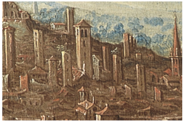
Incoronazione della Vergine, di Guglielmo Caccia (il Moncalvo), chiesa di San Bernardino, partic., 1601