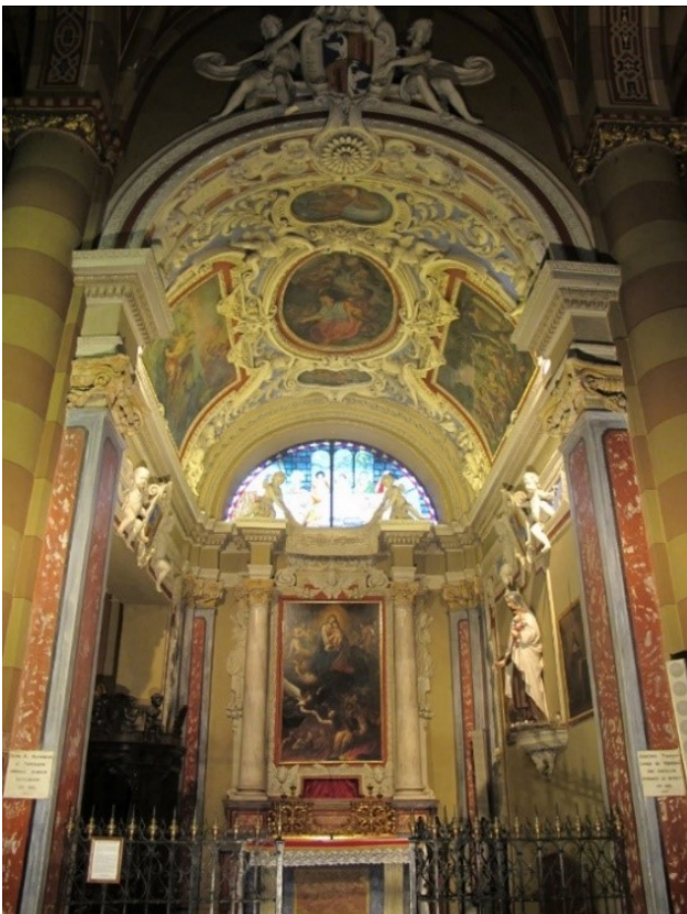
Cappella della Beata Vergine del Suffragio (Duomo)