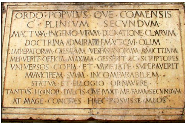
Targa in onore di Plinio il Vecchio, posta sulla facciata della Cattedrale di Como, città in cui lo scrittore latino era nato nel 23 d.C.

anche di carattere politico e morale, e ne traspare l'ideale cui P. conformò la sua vita: il desiderio vivo e costante di imparare, in un uomo per cui il sapere era la condizione fondamentale dell'esistenza umana. La sua opera, letta e studiata nei secoli successivi e nel Medioevo (che ne ha tramandati 200 manoscritti), consultata con venerazione nel Rinascimento, rimane oggi documento fondamentale delle conoscenze scientifiche dell'antichità.