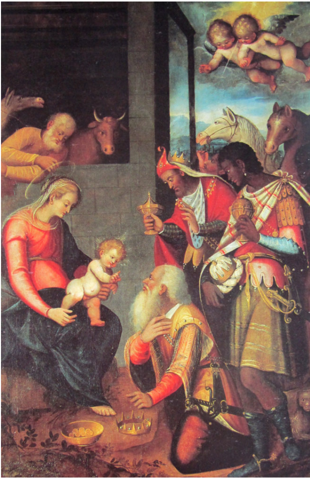
Francesco Fea ?, Chiesa di S. Guglielmo, Adorazione dei Magi