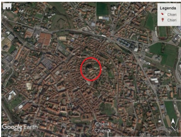
Insedimento celto ligure – Capanne sulla collina di S. Giorgio. Scavi di vicolo Tre Re e via Visca (IV-III a.C.)

Il primitivo insediamento celto-ligure (IV sec. a.C.) a Chieri doveva sorgere su terrazzamenti lungo le pendici della Rocca di San Giorgio. Un fondo di capanna e i resti di un'area per la cottura di ceramica furono individuati dalle indagini archeologiche svolte in via Visca; altre tracce emersero nel corso degli scavi di via Palazzo di Città e di vicolo Tre Re.