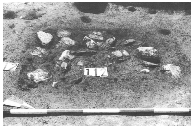
Chieri, Via Visca, Area per la cottura della ceramica, IV - III sec. a.C. QuadAPiem, 16, 1999, Scavi 1996 [Quaderni della Soprintendenza archeologica del Piemonte]