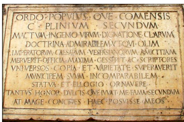
Targa in onore di Plinio il Vecchio, posta sulla facciata della Cattedrale di Como, città in cui lo scrittore latino era nato nel 23 d.C.

anche di carattere politico e morale, e ne traspare l'ideale cui P. conformò la sua vita: il desiderio vivo e costante di imparare, in un uomo per cui il sapere era la condizione fondamentale dell'esistenza umana. La sua opera, letta e studiata nei secoli successivi e nel Medioevo (che ne ha tramandati 200 manoscritti), consultata con venerazione nel Rinascimento, rimane oggi documento fondamentale delle conoscenze scientifiche dell'antichità.