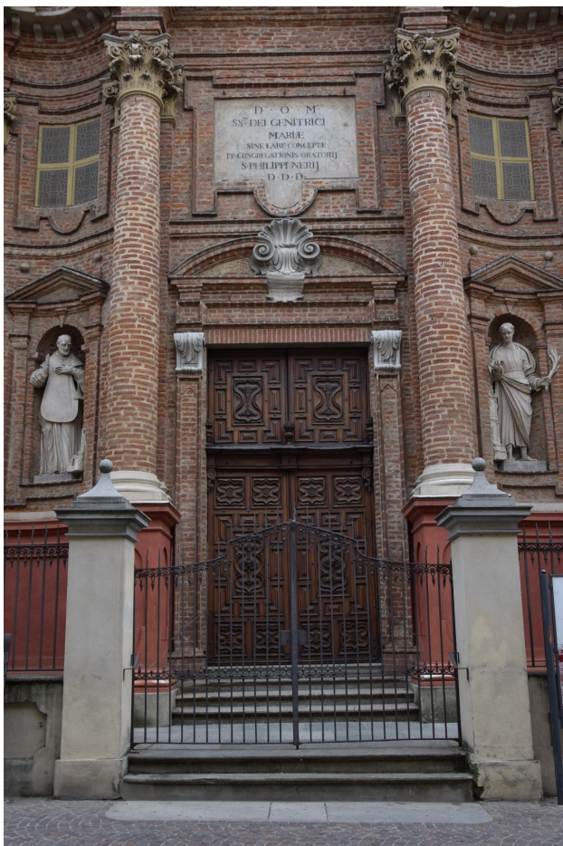
Chiesa di San Filippo Neri con intitolazione a Maria Vergine, Madre di dio – Portale e statue in stucco (Francesco Mambrini, 1759)