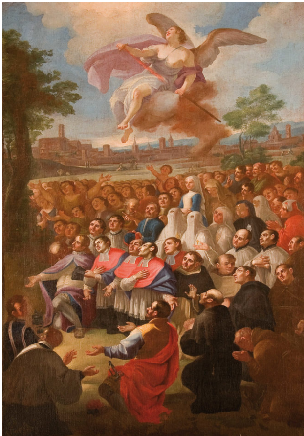
Clero, confraternite e popolo invocano la protezione della Vergine - Giuseppe Sariga, Cappella della Madonna delle Grazie, Duomo