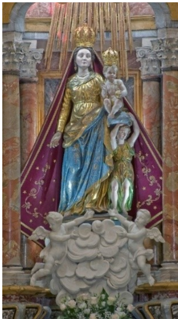
La statua lignea di Pietro Botto di Savigliano (1642) ora collocata nella Cappella della Madonna delle Grazie, Duomo di Chieri