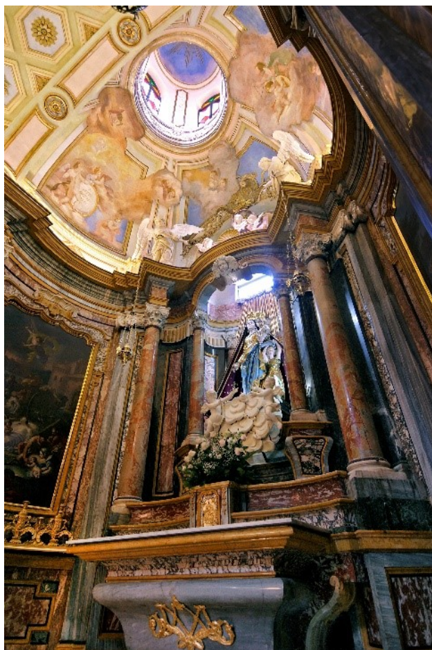
La cappella municipale della Madonna delle Grazie

progetto settecentesco di Bernardo Vittone che intervenne su un sacro sacello realizzato tra il 1632 e il 1636. Le due grandi tele del Sariga sono del 1759.