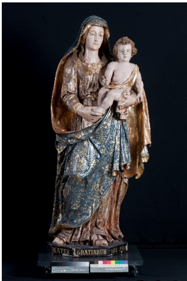
Madonna delle Grazie: la prima statua

Gesù in braccio, dal 1603 collocata nella sacrestia del Duomo; il particolare del coronato monogramma mariano "MG" dipinto sulla veste, riaffiorato durante le fasi del restauro, e la nota scritta da un puntiglioso canonico del Duomo in un libro capitolare, rende sempre più fondata l'ipotesi che sia questa la prima Madonna delle Grazie.