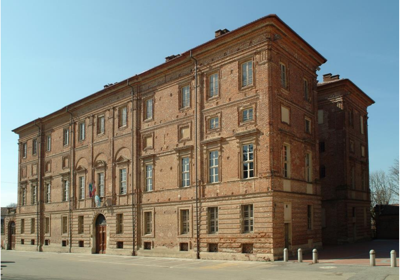
Riva, Palazzo Grosso

DOCUMENTI DI STORIA NEL TERRITORIO CHIERESE di GUIDO VANETTI Se i monumenti di Chieri permettono di tracciare, senza soluzione di continuità, la vita artistica e culturale della città, non diversamente il suo territorio reca testimonianze significative di oltre due millenni di storia, dai reperti archeologici preistorici del Bric San Viter nel territorio pecettese, presso l'Eremo dei Camaldolesi, alle tracce della centuriazione dell'agro romano nella campagna di Riva presso Chieri, al misterioso ipogeo longobardo di Marentino.