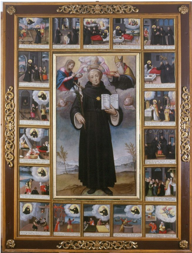
Guglielmo Caccia e Francesco Fea, Chiesa di S. Bernardino, Sala delle Consorelle, San Nicola da Tolentino