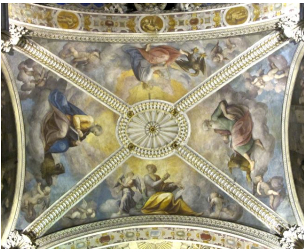
Guglielmo Caccia e aiuti, Volta del presbiterio, Quattro Evangelisti