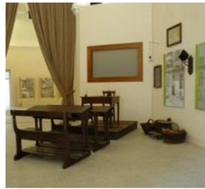
Una sala del Centro Visite Don Bosco di Chieri