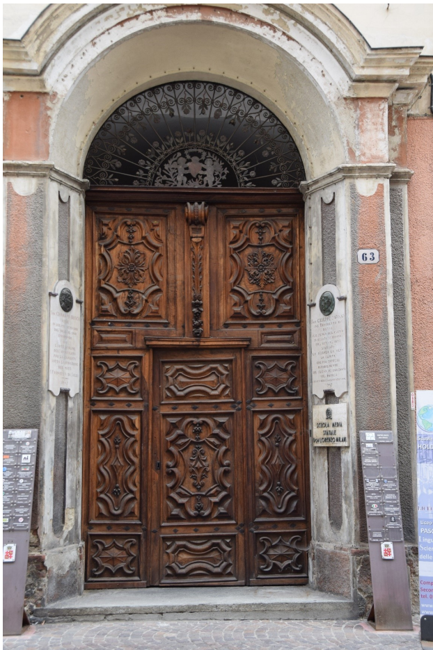
Porta d'ingresso del convento al numero 63 di via Vittorio Emanuele II. Le lapidi ne ricordano l'uso a Seminario e a Scuola Media. Sulla lunetta: il cuore dei Padri dell'Oratorio.