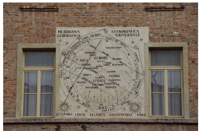
La meridiana del cortile