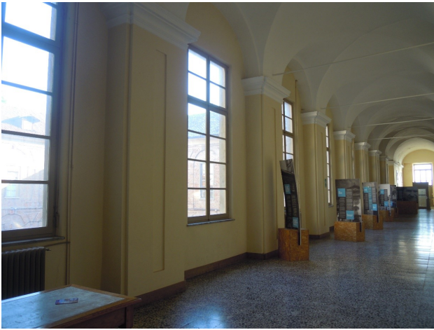
Corridoio del convento (arch. Giovanni Amedeo Galletti, 1780 circa)