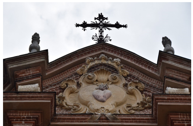
Frontone della chiesa con il cuore, simbolo della Congregazione dell'Oratorio