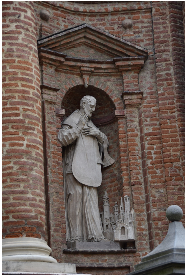
Chiesa di San Filippo Neri – Il santo benedice la Città di Chieri (Statua in stucco, Francesco Mambrini, 1759).