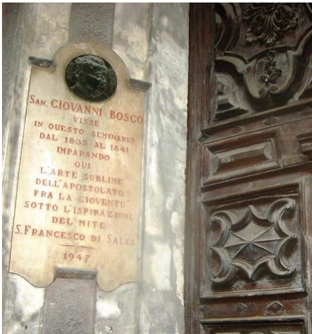
Via Vittorio Emanuele II, 63 - Porta d'ingresso del Convento con lapide commemorativa di don Bosco