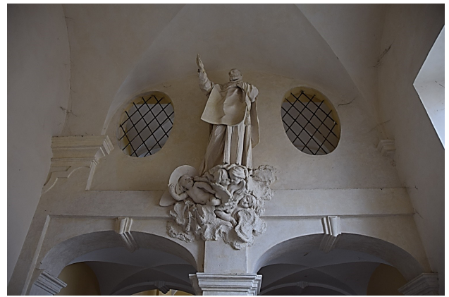
Scalone del convento – Statua di San Filippo sorretto da fanciulli dell'Oratorio. Uno di questi gli ha sottretto il cappello di cardinale, carica che Filippo aveva rifiutato.