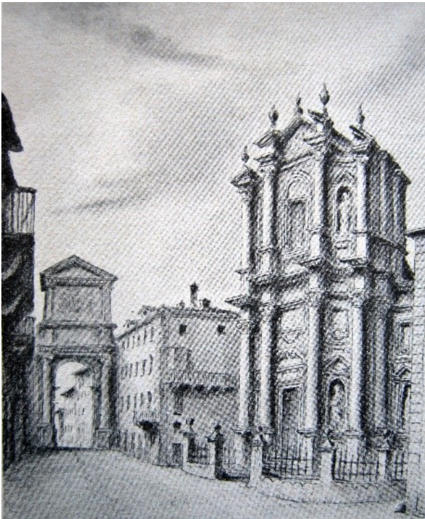
Via Vittorio Emanuele II – Chiesa di San Filippo Neri e Arco di Piazza (dis. Clemente Rovere, 1850)