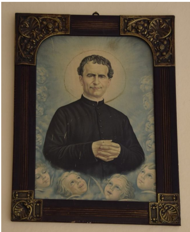
Rappresentazione di Don Giovanni Bosco