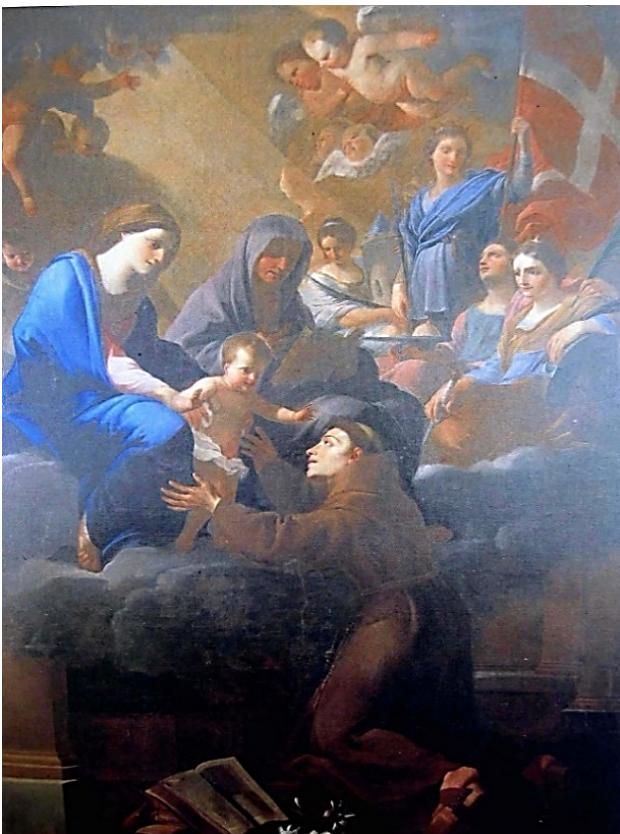
Duomo, Cappella dei Sant'Anna e Sant'Antonio da Padova - Jan Miel, "Sant'Anna e Sant'Antonio da Padova", 1651