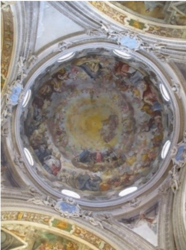
Chiesa di Santa Margherita - Affreschi (1670) dei pittori comaschi Giovan Paolo e Giovanni Battista Recchi.