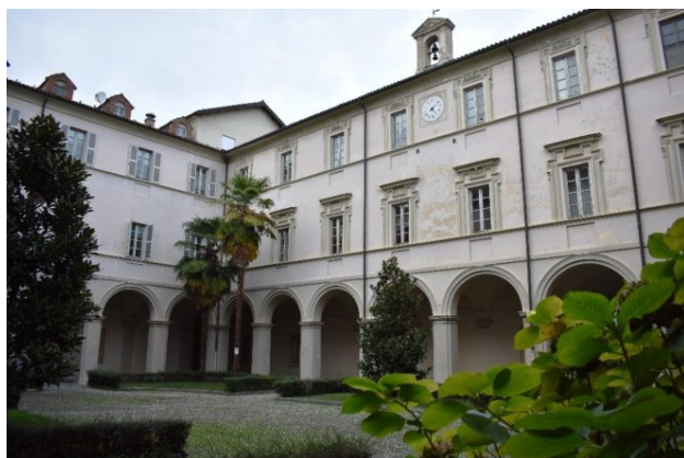
Chiostro del Noviziato dei Gesuiti - Il noviziato, attiguo alla chiesa di Sant'Antonio Abate, fu costruito in più fasi dal 1627 al 1700 per volontà del

Morì a Torino il primo settembre 1683. Fu sepolto nella chiesa di Sant'Eusebio, l'attuale chiesa di San Filippo Neri. Dalla moglie Margherita aveva avuto tre figli: Giacomo Vittorio, Michelangelo e Giovanni Battista, anche loro dediti all'attività edilizia.