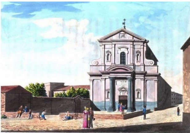
Santuario dell'Annunziata di Chieri

Santuario dell'Annunziata - Disegno acquerellato di Modesto Paroletti (1825)