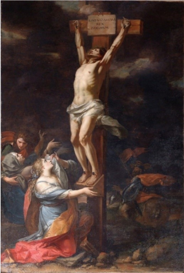
Duomo, Cappella del Crocifisso - Charles Dauphin, “Crocifissione”, 1662 ca

È il sito della Grande Pinacoteca di Cento Torri , un “grande museo virtuale in cui sono esposti e illustrati tutti i dipinti presenti a Chieri, nelle chiese, negli uffici pubblici e in ogni altro luogo accessibile”. Per ogni chiesa o sede diversa, troverai schede scritte da Antonio Mignozzetti.