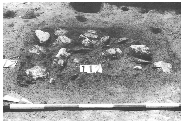
Chieri, Via Visca, Area per la cottura della ceramica, IV - III sec. a.C. QuadAPiem, 16, 1999, Scavi 1996 [Quaderni della Soprintendenza archeologica del Piemonte]