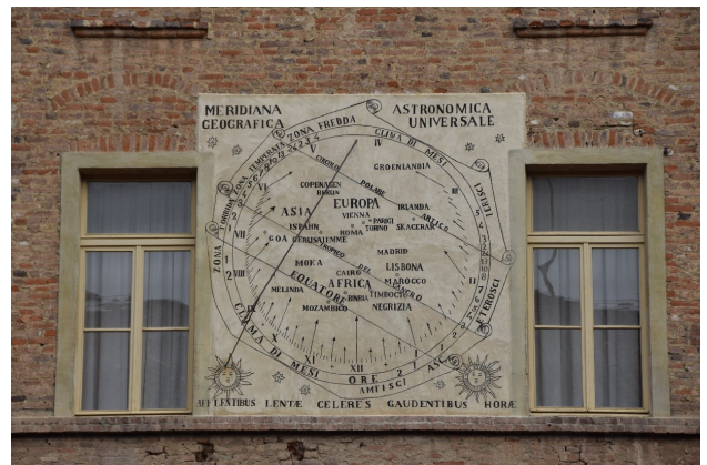
La meridiana del cortile