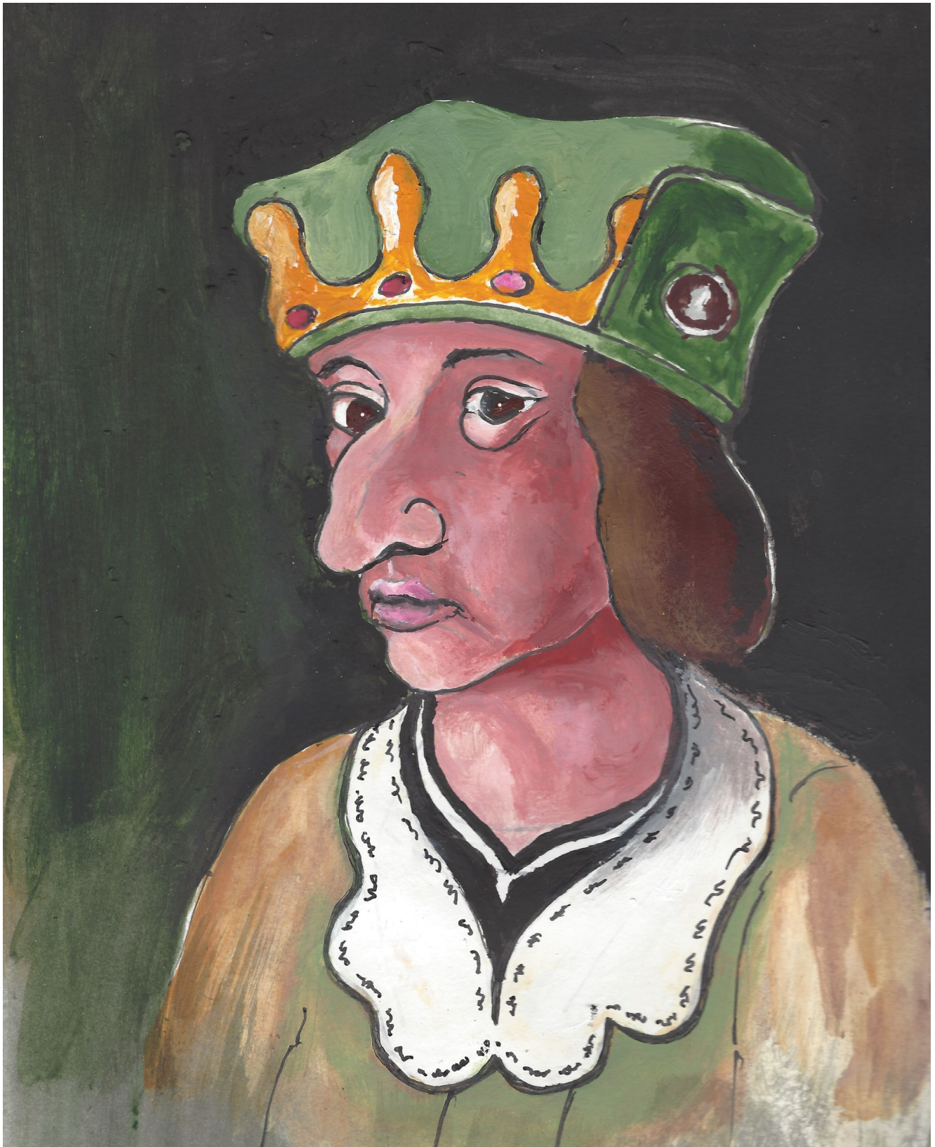
Carlo VIII ritratto da Maurizio Sicchiero in: Storia di Chieri illustrata. Fatti, personaggi, curiosità, Chieri, 2021, p. 63