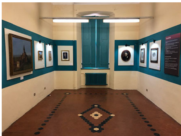
Saletta Maso Gilli, in San Filippo a Chieri

(da http://www.compagniadellachiocciola.it )